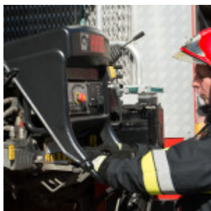
Piknik strażacki we Wrocławiu