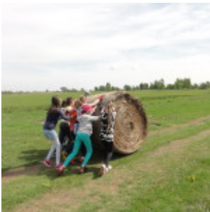
Przemkowski Park Krajobrazowy