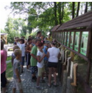
Szkoła Leśna w Bielawie