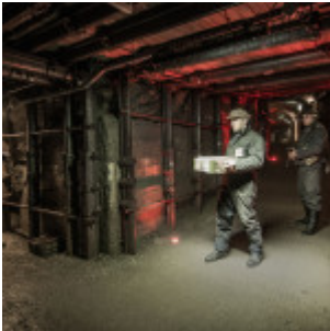
ARADO w Kamiennej Górze