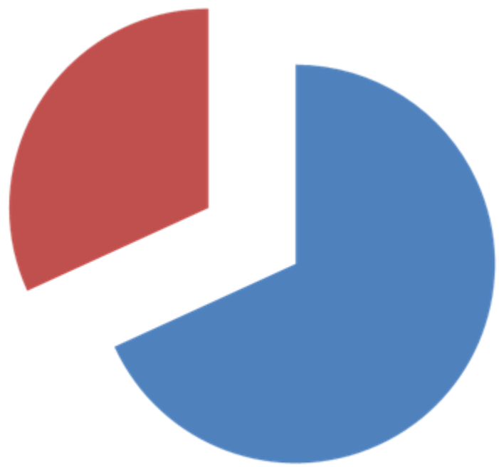
■ wkład unijny ■ wkład krajowy